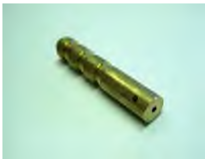
Figuur 2.3 zettingsbout

In een eerder stadium zijn op diverse plekken in de fundering/gevel van de panden langs rak 4 west zettingsboutjes aangebracht zoals weergegeven in (figuur 2.3). De zettingsboutjes zijn door Wiertsema & Partners aangebracht. De locaties van de zettingsboutjes zijn weergegeven op bijlage 1.